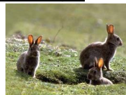
Le lapin de garenne